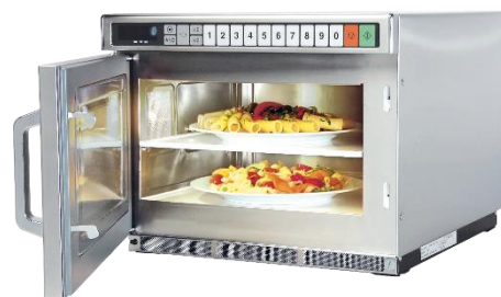
Possibilité de réchauffer 2 assiettes